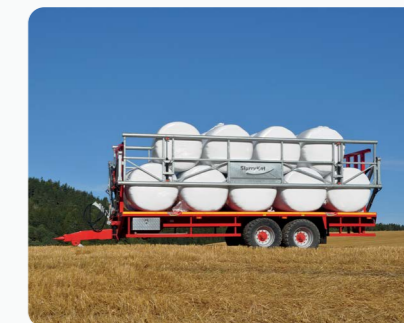
Remorque plateau 32 ft avec serre- balles hydraulique