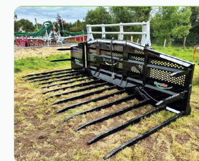
Fourche a ensilage Proline 14ft