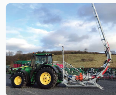
Kit épandage sans tonne Skorpion