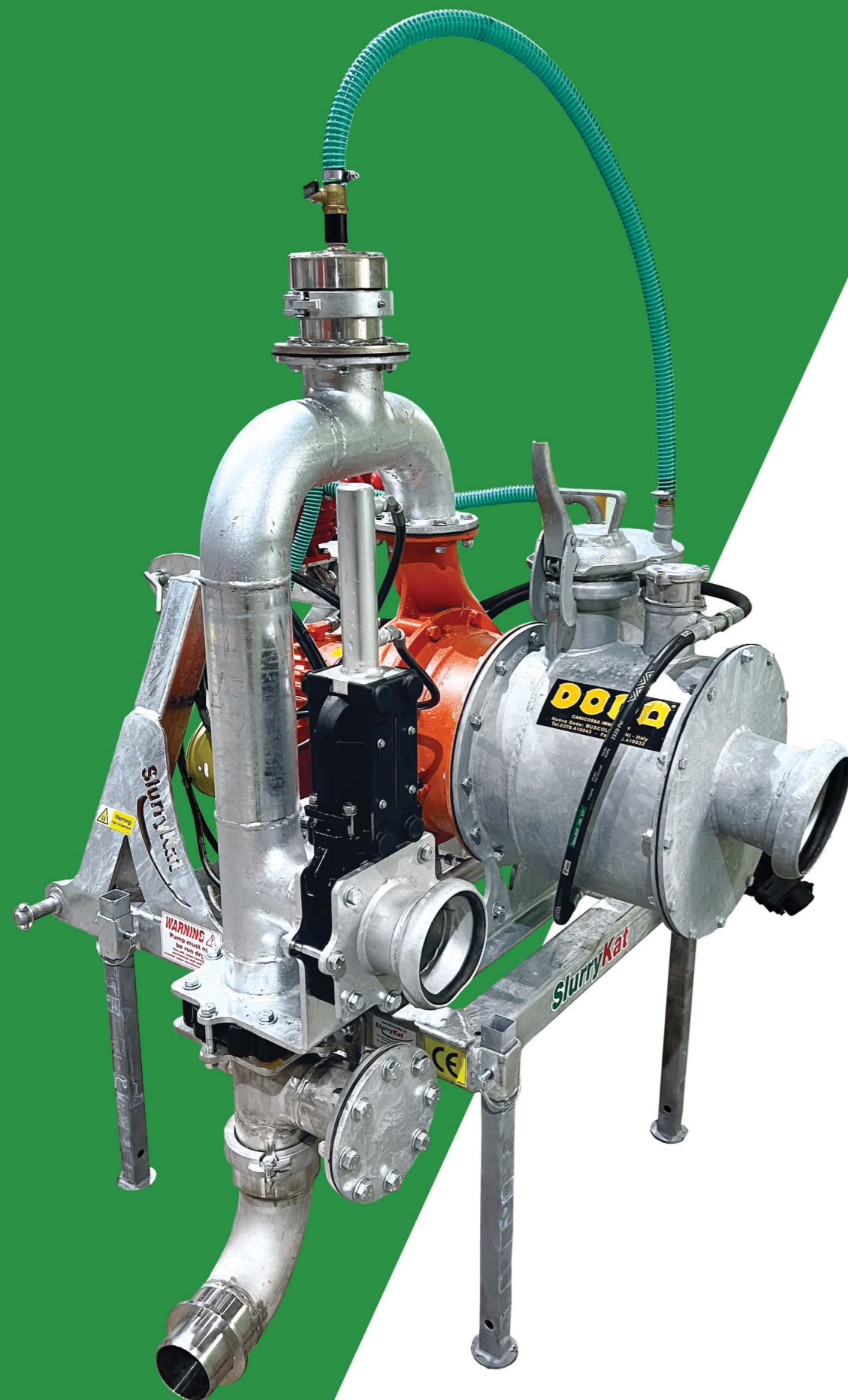
Pompe à lisier AFI HD35