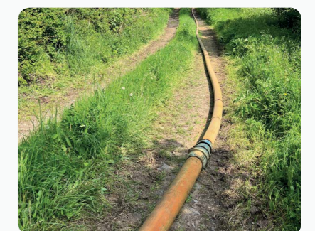
Configuration Tuyauterie Oroflex 20 de 5" a 4" avec raccords tournants acier inox Slurrykat