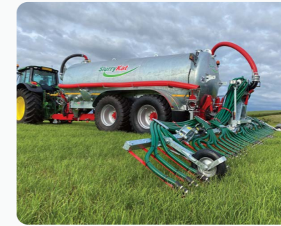
Tonne à lisier Galvanisée 18m 3 /4000G Premium Plus™ avec Rampe a Patins 10m