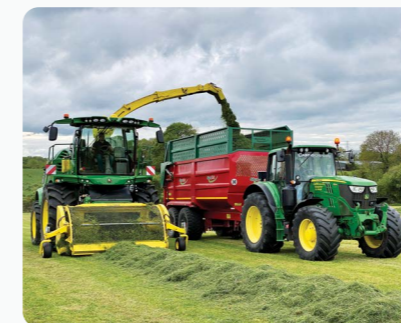
Benne a ensilage Proline avec pneus basse pression