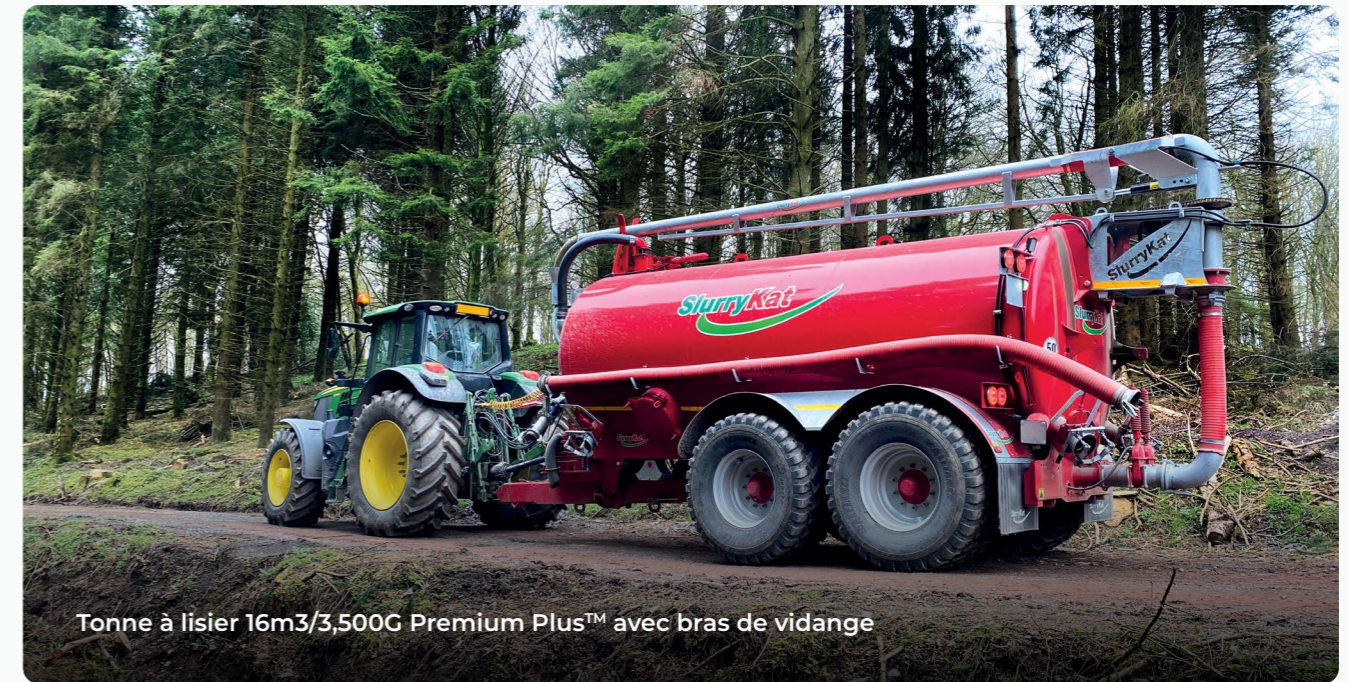
Tonne à lisier 16m 3 /3,500G Premium Plus™ avec bras de vidange