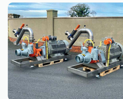
Moteur DODA® AFI L35 160KW avec système de gestion des manœuvres en tournière