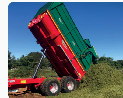
Remorque a Ensilage à bascule