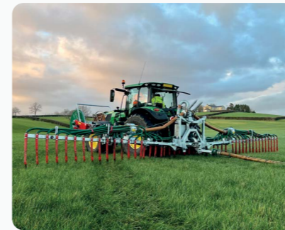
Rampe a pendillards 12m Premium Plus™ Duo