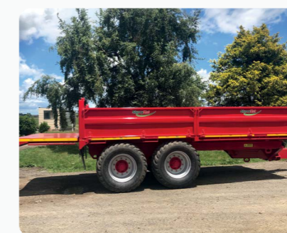
Remorque a ridelles rabattables avec pneus 550/45R22.5 & rallonge porte balle optionnelle