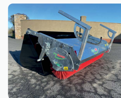
Balayeuse & godet 8 ft