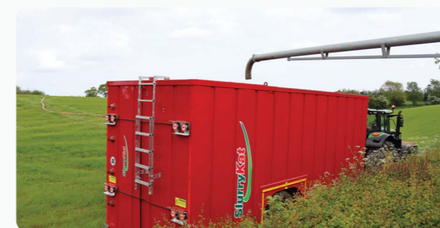
Cuve à lisier Mobile 65m 3 – Livrée prête à l'emploi & mise en place en 5mn