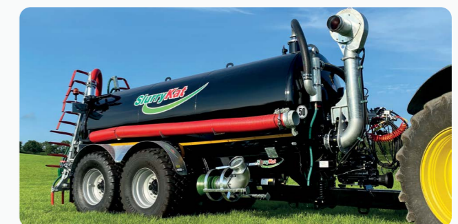
18m 3 -/4,000G essieu directionnel arrière, Auto remplissage 8" avec Pompe turbo & rampe à pendillards