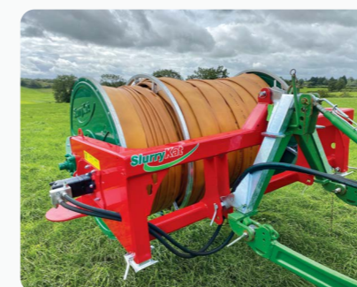
Option fixation rapide châssis adaptable en A galvanisé