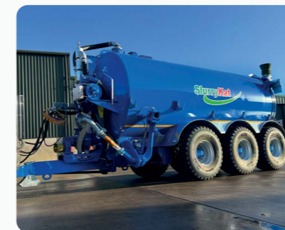
Tonne à lisier 22.5m 3 /5,000G Triple-essieu, Train roulant directeur Avant & Arrière