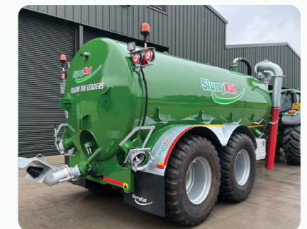
Tonne à lisier 16m 3 /3500G/ Premium Plus™ avec Bras de chargement 8" à rallonge avec pompe Turbo Intégrée et Système de Brassage Interne pour sable/sédiments