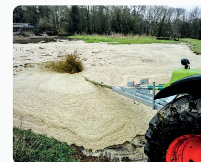
Modèles 7.5m - 12m