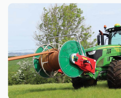
Un Enrouleur avant embobine 1000m de tuyaux