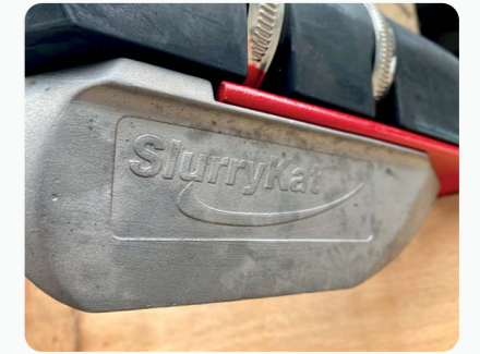
Extrémité de la rampe a patins