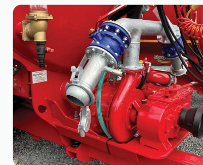
Kit de pompe double DODA® L35/Battioni Evo – déchargement a 12 bar/250m 3 par heure en alimentation d'épandage sans tonne