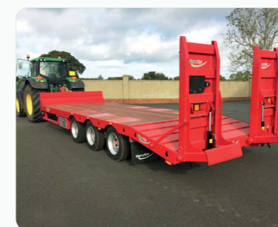
Remorque porte-engins 25T Triple essieu avec rampes hydrauliques