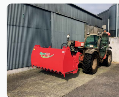
Godet à désiler fabriqué en acier S355 haute résistance & dents acier Hardox 450 pour une longue durabilité en applications contraignantes