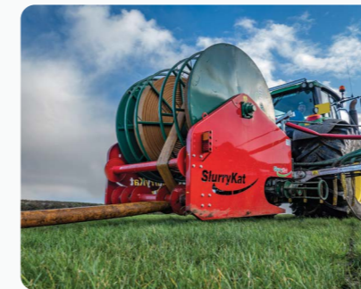
Système SlurryKat Bak-Pak™