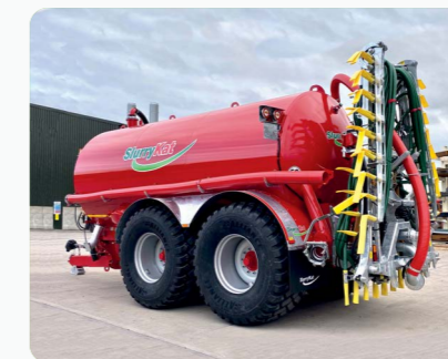
20m 3 /4,500G/ sur pneumatiques 750/60R30.3