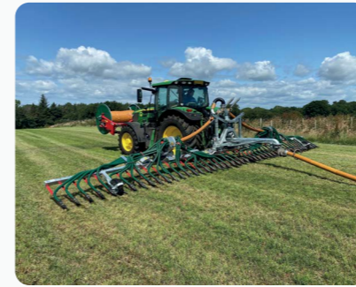
Rampe a patins 12m Premium Plus™ avec Enrouleur a tuyau montage avant