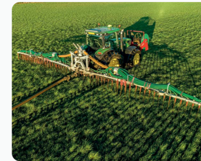
Rampe a pendillards 15m Premium Plus™ Duo