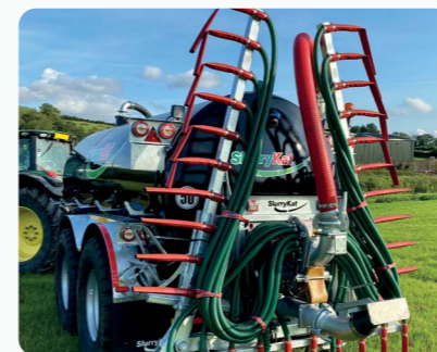
Tonne à Lisier avec Rampe a Pendillards en position de transport