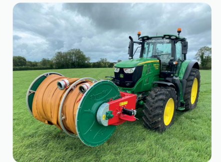
Enrouleur Avant avec raccords tournants SlurryKat