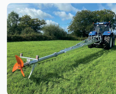
Mixeur à lisier Maxi : Systèmes de Mixage par agitateur