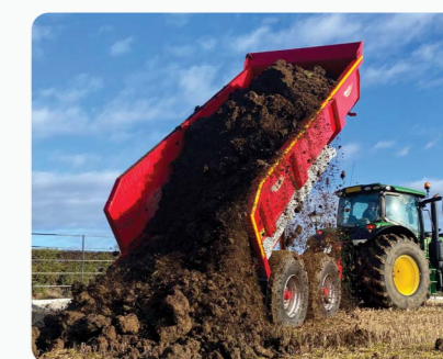
Remorque à bascule 22 Tonne à bas profil